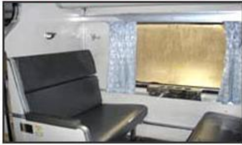
เวลากลางวัน (Day Time)