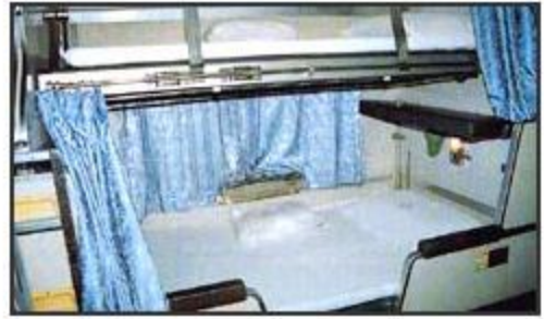
เวลากลางคืน (Night Time)